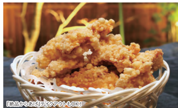
「絶品からあげ」テイクアウトOK!

「ぼちっ」持参で 2,000円以上のコースをお選びの方に グラスワインorノンアルコールグラスワインを1杯プレゼント! 2020.11.22迄