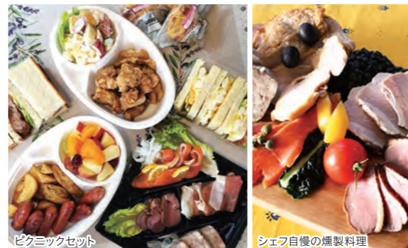
ピクニックセット

「ぼちっ」見たで 1人用おせち9,000円(税別)を 早割8,000円(税別)(限定30食) 2020.10.31迄